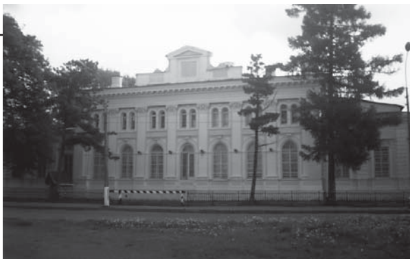
Офицерское обитание сегодня

Сидели уланы на рыжих (напоминаю, что в гвардейской кавалерии одномастный состав сохранился до самого ее — царской гвардии — конца), только в пятом и частично в шес-