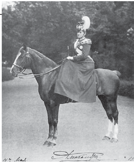
Императрица Александра Федоровна в форме Лейб-Гвардии Уланского полка 15 мая 1903 г.

В 1809 году (помните? — именно в этом году полк был причислен к гвардии) полк был снова переформирован, на его базе был создан еще и Драгунский полк (император Александр I желал таким образом усилить гвардейскую кавалерию), который сразу же получил назначение в Петергоф. С этим полком, впоследствии