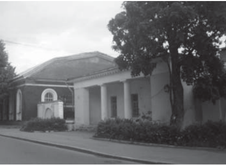
Гауптвахта и манеж

На полях сражений уланы сразу же покрыли себя славой.