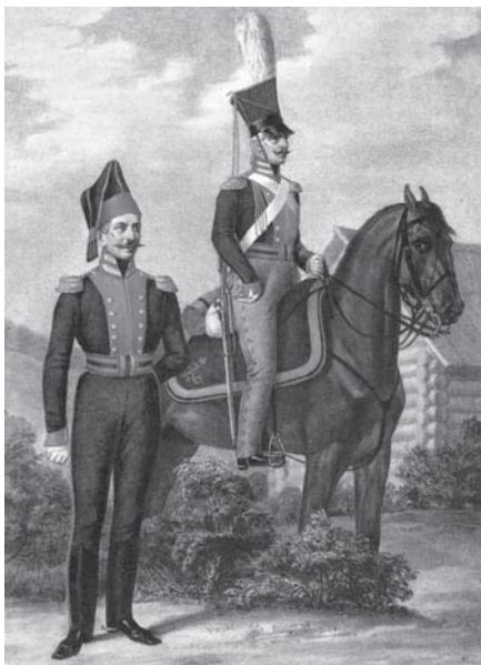
Рядовые Уланского Ея Высочества Цесаревича Константина Павловича полка, 1803-1806 гг

...Именно по желанию будущего Великого князя и был создан первый в России регулярный Уланский полк,