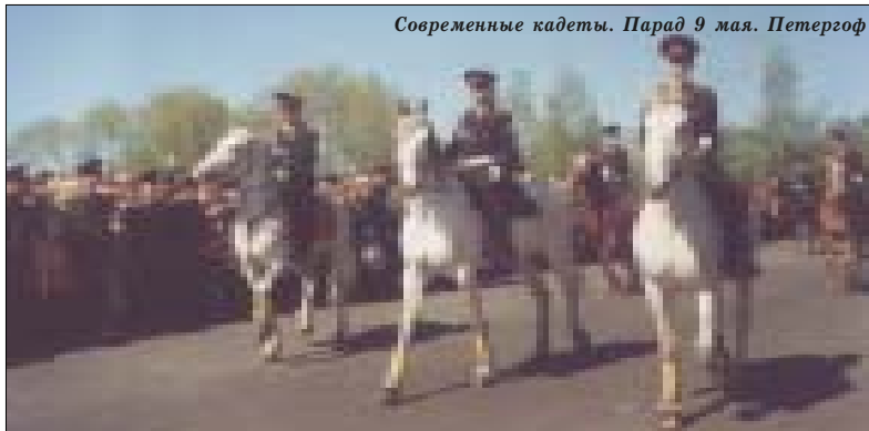
Современные кадеты. Парад 9 мая. Петергоф

Что же, препояшем чресла — и в путь, в путь, мои дорогие, по дорогам и тропам российской истории!