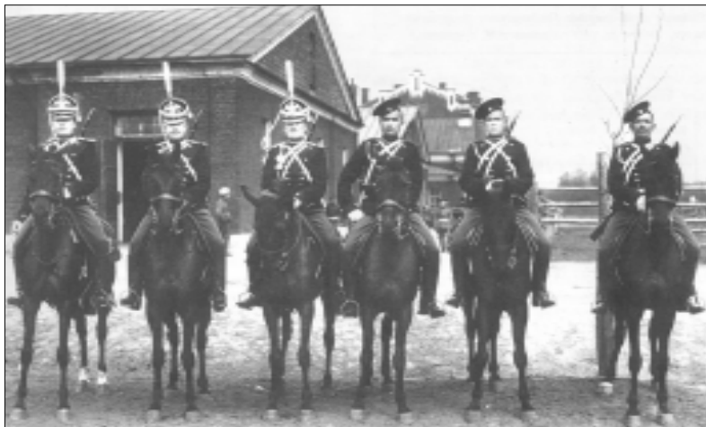
Нижние чины Лейб-Гвардии Драгунского полка в парадной и обыкновенной формах. 1910 гг.

цем метра на полтора, стало быть, и попасть в тебя проще. В конце концов, к XIX веку и практики, и теории сошлись на том, что конница должна быть вооружена холодным оружием — колющим ли, вроде пики, или рубящим, на манер сабли или палаша. Из кавалерии — там, где они еще оставались — исчезли полки конных карабинеров, аркебузирив, мушкетеров, егерей.