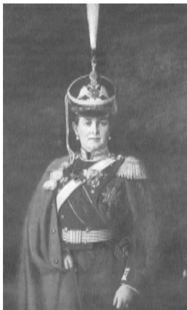
Великая Княгиня Мария Павловна в парадной форме Лейб-гвардии Драгунского полка, 1912 г.

Назимов, отбиваясь саблей от группы черкесов, изрубил несколько человек, прежде чем сам был застрелен вместе с еще двумя офицерами.